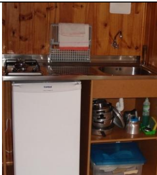
minicozinha dos chalés