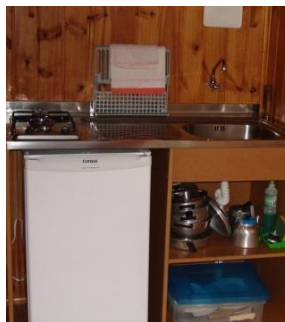
minicozinha dos chalés